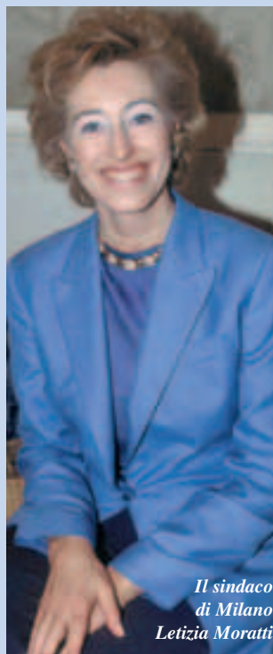
Il sindaco di Milano Letizia Moratti

nismo fiscale assurdo perché consente al governo centrale - altro rilievo di Cofferati - di presentarsi come difensore dei poveri mentre i sindaci dovrebbero vessarli. E' la conseguenza della mancata riforma fiscale che dovrebbe responsabilizzare - in modo chiaro ed equo - l'amministrazione centrale e quelle periferiche dello Stato (Regioni, Province e Comuni) per la quantificazione delle imposte e delle tasse, per la quota del gettito complessivo da attribuire a ciascuna di esse, e per stabilire le regole essenziali in base alle quali le diverse amministrazioni utilizzeranno le risorse a loro disposizione. Solo con questa riforma, infatti, le decisioni di prelievo e di spesa potranno essere assun-