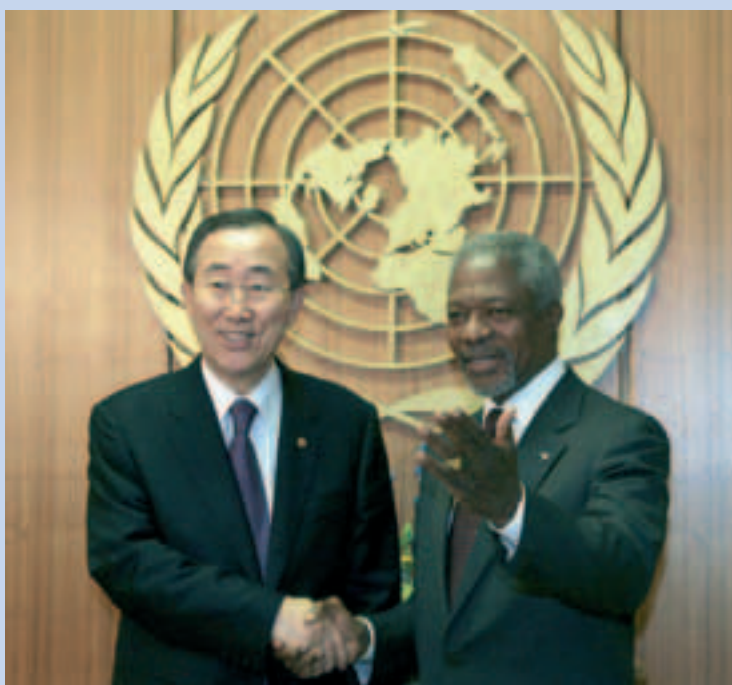
Passaggio di consegne all'Onu. Stretta di mano tra il nuovo segretario generale Ban Ki-moon (a sinistra) e l'uscente Kofi Annan.

Cina, l'Europa, una Russia che ha recuperato il suo ruolo. Come ha dimostrato l'impegno che è stato preso in Libano, dal quale sono assenti Stati Uniti e Gran Bretagna, mentre l'Ue è presente in quanto tale. Ma al mondo che sta ormai diventando multilaterale si aggiungono l'America latina, stanca di ritrovarsi tributaria e vassalla del vicino nord, l'India con il suo potenziale di tecnologia, l'universo islamico che non è fatto solo di cellule terroristiche. Il nuovo segretario dovrà farsi interprete di questi mutamenti e pilotare l'Onu verso quelle riforme che interesseranno in primo luogo il Consiglio